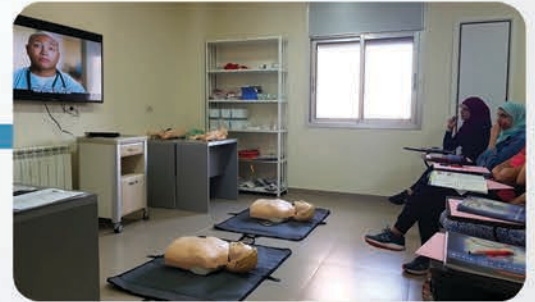
عناية الـ Corona

تخصيص وتجهيز قسم خاص وعناية فائقة لمرضى الكورونا