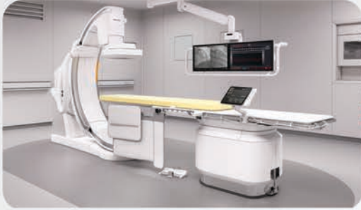
قسم أمراض القلب

تزويد قسم أمراض القلب بآلة حديثة من أجل إجراء قسطرة قلبية (تميل لشرايين القلب) وفق أفضل المعايير